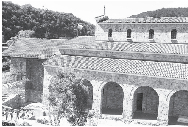
Църквата „Свети Четиридесет мъченици“ във Велико Търново, в която е обявен актът на независимостта

След Съединението през 1885 година България започва да се развива с темпове, които удивяват света. Възходът на младата